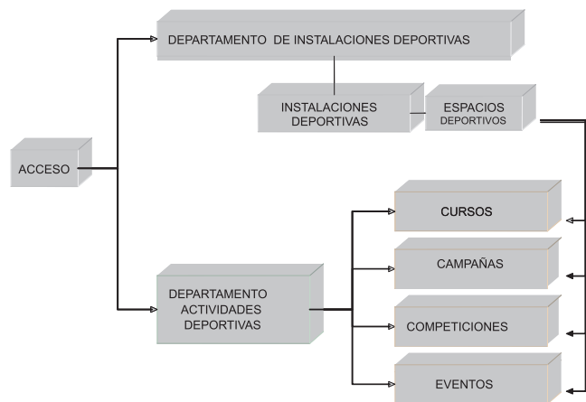
Figura 2 – Proceso productivo – Departamento de instalaciones deportivas.

puede conllevar el uso de las propias instalaciones gestionadas por el Departamento de Instalaciones Deportivas, por lo que ambos componentes de la estructura orgánica intervienen en la prestación del servicio, de tal manera que la representación gráfica de su proceso productivo podría ser la que aparece en la Figura 2: